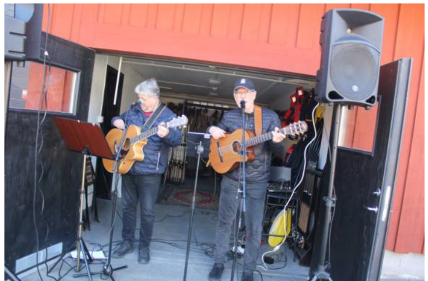
Reporter/Foto: Christer Svensson Foto: Coco Nilsson.